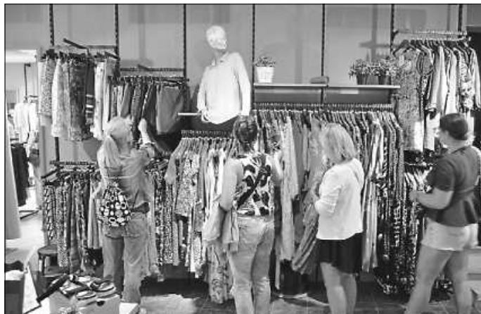
Angebot der Secontique

Wer in der Zwischenzeit wertige Gebrauchtkleider abgegeben hat, darf sich gerne an die Secontique in Nürtingen in der Marktstr. 4 gegenüber dem Rathaus wenden. Dort können die Kleidungsstücke auch auf dem Bügel hängend oder in Kartons abgegeben werden. Aus den Erlösen Ihrer Spenden werden soziale Zwecke bezuschusst, insbesondere Eine-Welt-Projekte im Globalen Süden.