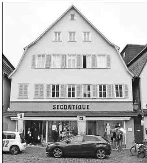
Secontique Nürtingen

Die in den letzten Jahren zu Martini übliche Kleidersammlung musste in diesem Jahr bereits am 01. Juli anlässlich des Bauernmarkts stattfinden. Die terminliche Vorverlegung war bedingt durch organisatorische Gründe seitens der Aktion Hoffnung. Auch im nächsten Jahr wird unsere Kleidersammlung wieder im Sommer stattfinden und zwar am 06. Juli ebenfalls beim Bauernmarkt.