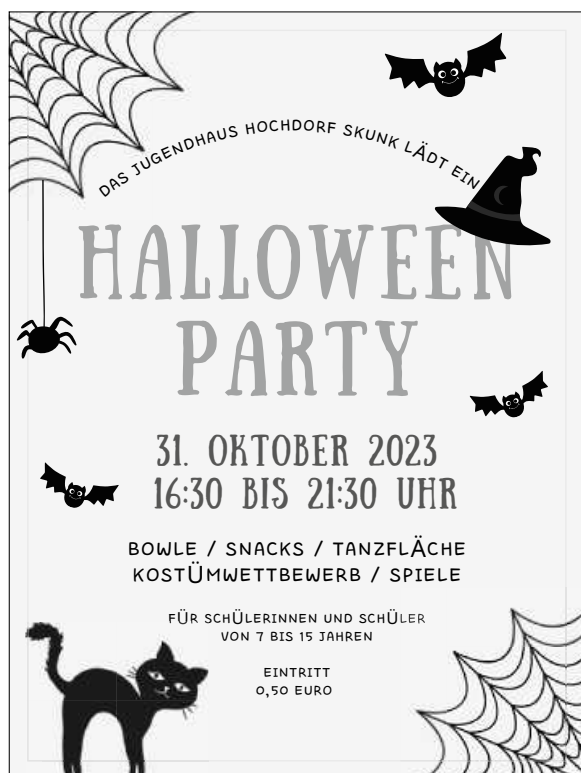
Plakat: Jugendhaus Hochdorf SKUNK (Kreisjugendring Esslingen)

Auch dieses Jahr findet im Jugendhaus wieder die beliebte Halloweenparty statt. Kommt vorbei und feiert diesen schaurig schönen Tag mit uns.