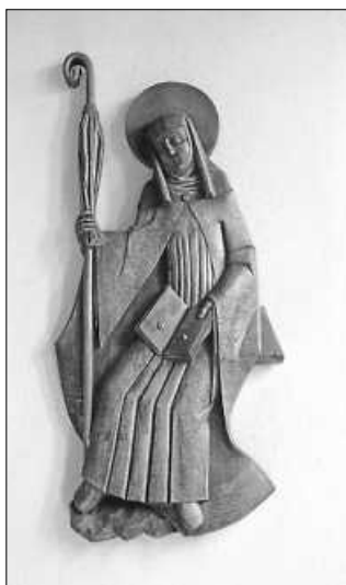
Hl. Ottilie

zu erreichen. Nun durfte man im November 2022 feststellen, dass mit den Bekanntmachungen ein Sammelergebnis von