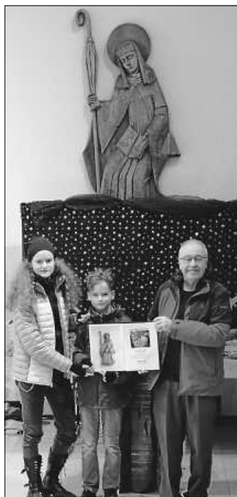
Übergabe der Urkunde

zu erreichen. Nun durfte man im November 2022 feststellen, dass mit den Bekanntmachungen ein Sammelergebnis von