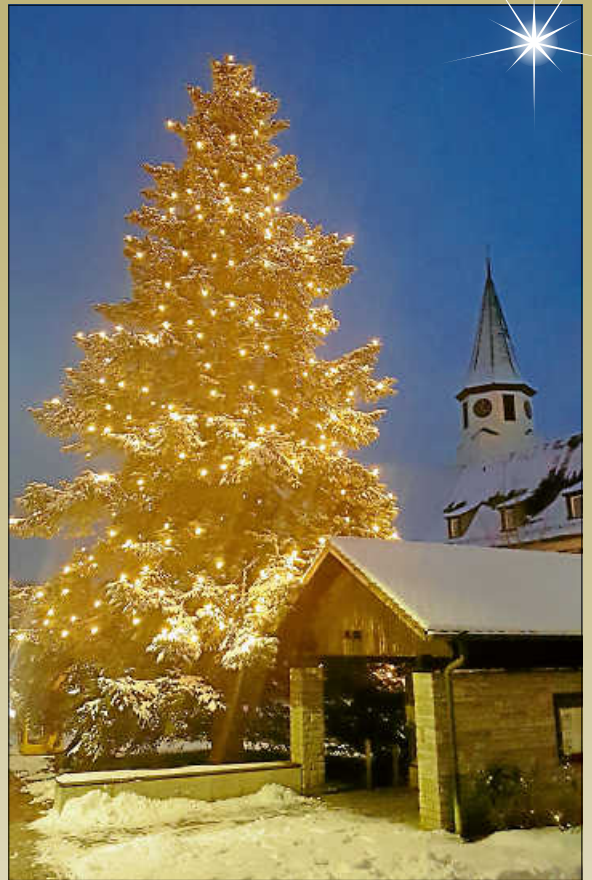
vielen Dank für das schöne Foto

Weihnachten ist das Fest der Liebe und Familie aber auch der Dankbarkeit. Daher möchten wir uns herzlich bei denjenigen bedanken, die sich auch in diesem Jahr auf verschiedenste Weise ehrenamtlich in unseren Gemeinden eingebracht haben. Wir wünschen Ihnen allen ein besinnliches und frohes Weihnachtsfest im Kreise Ihrer Lieben sowie alles Gute, Gesundheit und Frieden für das Jahr 2023.