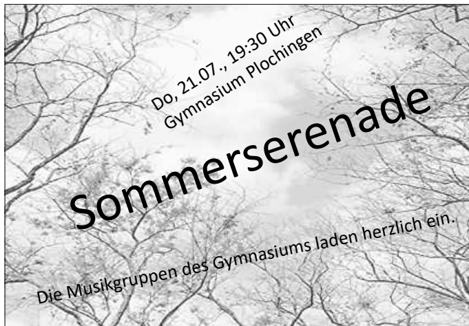
Plakat: Burkhard Wolf