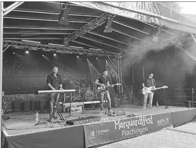
Band „Feeling Mountains“ mit ehem. Schülern beim Stadtfest