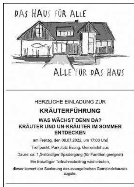
Kräuterwanderung Plakat: Pfarramt