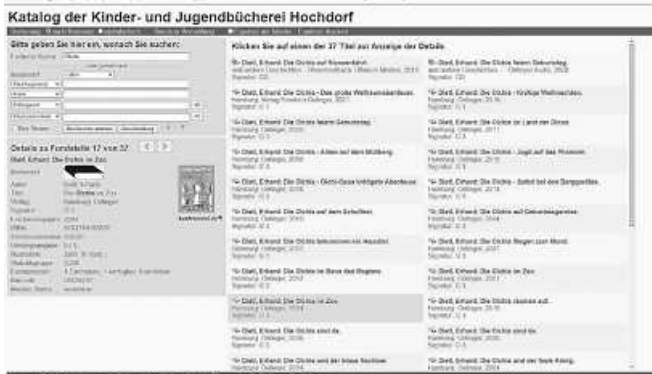
So sieht der neue Online-Katalog der Bücherei aus.

Zu finden ist er auf der Homepage der Bücherei ( www.hochdorf.de/wohnen-leben/kultur-bildung/buecherei ). Hier kann bequem von zu Hause oder unterwegs im Bestand der Bücherei gestöbert werden, Sie können Medien vorbestellen oder sogar das eigene Leserkonto einsehen und Verlängerungen tätigen. Einfach mal vorbei-klicken!