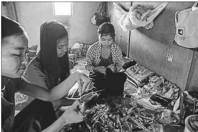
Heimarbeit statt spielen

Der Welttag gegen Kinderarbeit bietet also einen guten Anlass, das persönliche Konsumverhalten zu überprüfen.