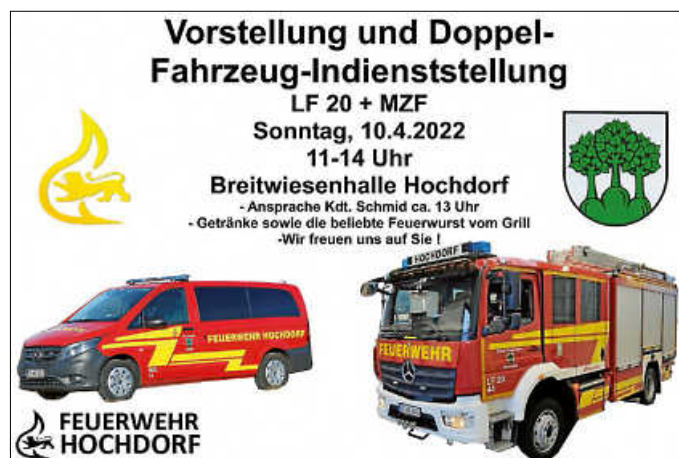
Plakat: FFW HD

Lange war es unklar, jetzt dürfen wir ganz herzlich einladen zur Vorstellung und Indienststellung unserer zwei neuen Einsatzfahrzeuge, dem LF 20 und dem MZF. Am Sonntag, den 10.4.22, von 11 bis 14 Uhr präsentieren wir die Fahrzeuge an der Breitwiesenhalle. Um 13 Uhr wird Kommandant Jochen Schmid eine kleine Ansprache zu den neuen Fahrzeugen halten. Aufgrund der aktuellen Lage freuen wir uns besonders, dass wir dieses seltene Ereignis mit Ihnen feiern dürfen. Kommen Sie vorbei und lassen Sie sich die neuen Fahrzeuge von uns zeigen und erklären. Wir dürfen auch eine kleine Verpflegung anbieten, daher werden wir Getränke sowie unsere beliebte Feuerwurst vom Grill anbieten. Wir freuen uns riesig, dass keine Auflagen mehr bestehen, und wir dieses erste „Fest“ seit zwei Jahren ausrichten dürfen. Schauen Sie vorbei und begrüßen Sie unsere zwei neuen Schmuckstücke und nehmen Sie Abschied von unserer „Tante Ju“, unserem LF 16, das ab diesem Tag nach 39 Einsatzjahren in den wohlverdienten Ruhestand darf.