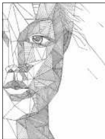
Grafik: Pia Unger

An den anderen Tagen findet im Rahmen des Mädchentreffs ein offener Treff statt, an welchem ihr frei wählen könnt, was ihr machen wollt. Ich freu mich auf euch!