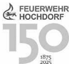
Logo: Feuerwehr Hochdorf

Wir freuen uns schon jetzt auf ein absolutes Highlight und dass wir unser 150-Jähriges zusammen mit Ihnen feiern können.