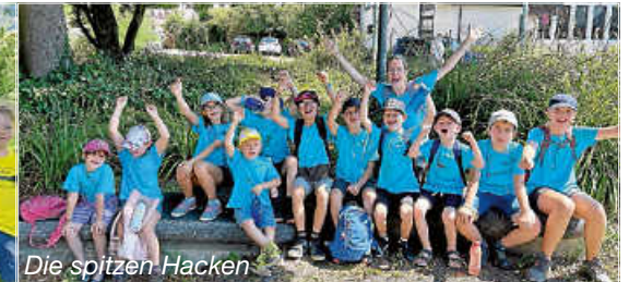
Die spitzen Hacken