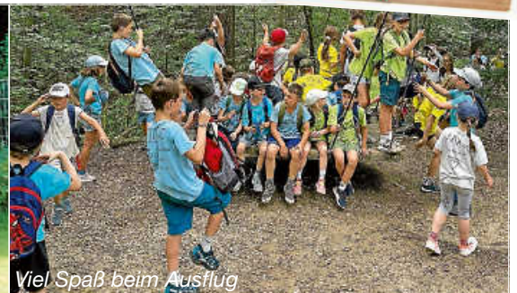
Viel Spaß beim Ausflug