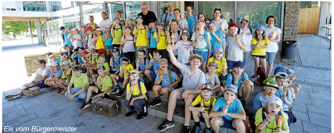
Eis vom Bürgermeister