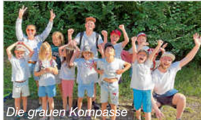
Die grauen Kompasser