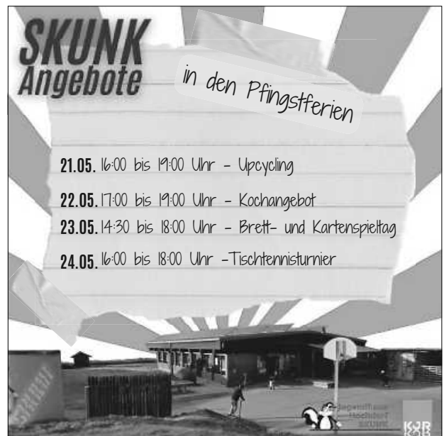
Plakate: Jugendhaus Hochdorf SKUNK

Parallel zur Öffnungszeit finden in den Pfingstferien für alle Jugendlichen ab der 5. Klasse kostenlose Angebote im Jugendhaus statt. Für die Teilnahme bedarf es keiner Anmeldung, einfach vorbeikommen und mitmachen!