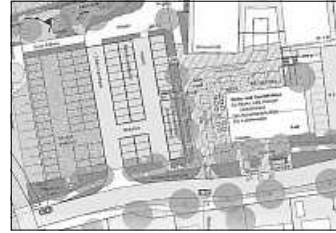
Planung des Breitwiesenparkplatzes

In der Gemeinderatssitzung am 23.11.2023 wurde der Entwurf für das Breitwiesenareal beschlossen und die Bauleistungen wurden im Februar 2024 ausgeschrieben. Von den acht eingegangenen Angeboten war das der Firma HSE-Bau deutlich günstiger als vorab kalkuliert, weshalb die Bauleistungen an diese Firma vergeben wurden.