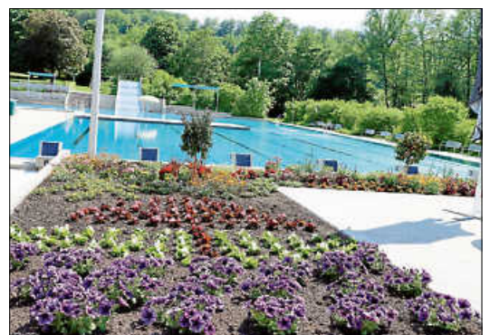
Rechtzeitig zum Saisonstart sind die Beete an der Freibadterrasse durch das Gärtnereiteam des Zweckverbands Reichenbach-Hochdorf schön blühend in Form gebracht worden