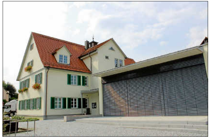
Rathaus nach der Sanierung