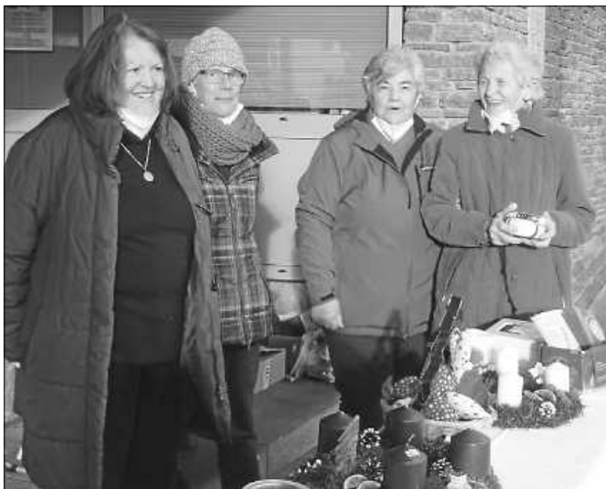
Bastelgruppe des OGV Reichenbach

Am letzten Samstag hat die Bastelgruppe des OGV traditionell ihre professionellen, selber hergestellten Adventskränze in Reichenbach verkauft. Der Ansturm am frühen Morgen war groß und die Stimmung war prima. Leider wurde ein zurückgelegter, aber nicht bezahlter großer Kranz dann doch nicht abgeholt, so dass er am Ende übrig blieb. Das haben wir alle doch bedauert. Trotzdem freuen wir uns als Hospizdienst zusammen mit der Bastelgruppe über die gelungenen Verkäufe. Der Erlös kommt unserer Hospizgruppe als Spende zu – dafür bedanken wir uns sehr herzlich beim OGV und insbesondere bei der Bastelgruppe.