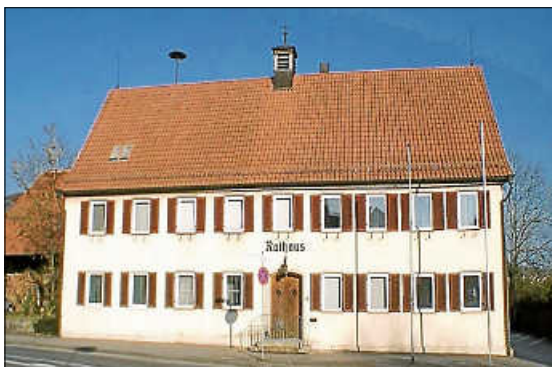
Rathaus vor der Sanierung

Weitere Informationen unter https://www.hochdorf.de/wohnen-leben/bauen-wohnen/sanierungsgebiet .