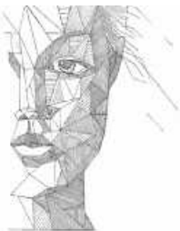
Grafik: Pia Unger

An den anderen Tagen findet im Rahmen des Mädchentreffs ein offener Treff statt, an welchem ihr frei wählen könnt, was ihr machen wollt. Ich freu mich auf euch!