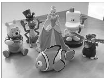
Das sind „die Neuen“!

Insgesamt gibt es in der Bücherei mittlerweile 48 Tonies zum Ausleihen - kommt doch einfach mal vorbei und schaut euch um.