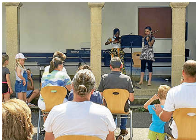
Tag der offenen Tür

unter sorgsamer Einhaltung der vorgegebenen Hygienemaßnahmen. Eröffnet wurde die Veranstaltung draußen vor der Musikschule mit einem abwechslungsreichen Konzert indem SchülerInnen der Musikschule ihre Instrumente musikalisch selber vorstellten. Den Auftakt dabei stellte das Musikzüggle mit dem Lied „Simama kaa“. Im Anschluss hatten alle Kinder die Möglichkeit nach Herzenslust Instrumente auszuprobieren und Eltern sich zu informieren. Die Lehrkräfte standen dabei beratend zur Seite. Das Interesse war groß und das Angebot wurde gerne und ausgiebig in Anspruch genommen. Alles in allem eine sehr schöner Auftakt und eine gelungene Veranstaltung!