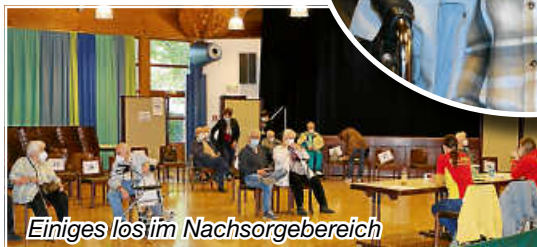
Einiges los im Nachsorgebereich