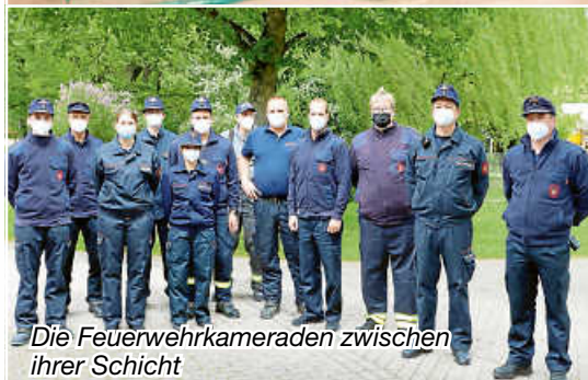
Die Feuerwehrkameraden zwischen ihrer Schicht