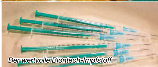
Der wertvolle Biontech-Impfstoff