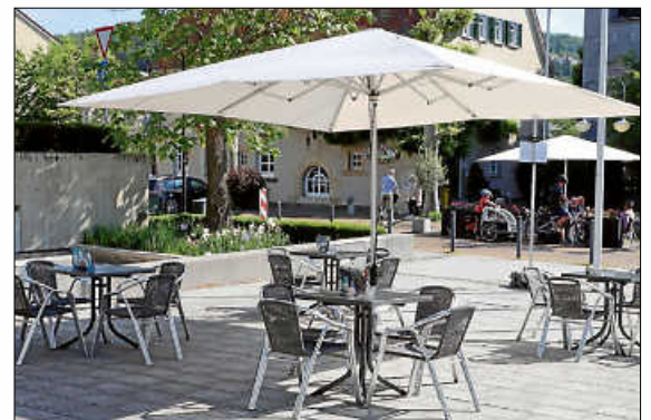
Auch auf dem Rathausplatz kann man es sich wieder gemütlich machen.