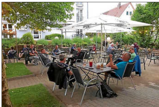
Die Gäste freuen sich, wieder in den Biergarten gehen zu können und sich auf Abstand zu treffen.

Für alle Begegnungen im öffentlichen Raum gilt: Halten Sie sich an die Vorschriften der Corona-Verordnung. Tragen Sie eine Mund-Nase-Bedeckung und schützen Sie sich und andere indem Sie Abstand halten und die bekannten Hygieneregeln beachten.