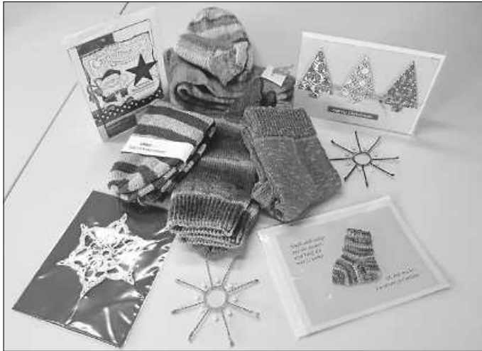
Eine kleine Auswahl

Tel.: 07153/39071 (Dienstags 10 – 15 Uhr, sonst AB) E-Mail: wernau@amsel.de