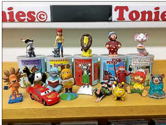
So sehen die neuen Tonies© aus.

Die Leihfrist für die Tonie-Figuren beträgt vier Wochen, pro Familie können max. 2 Tonies entliehen werden. Also gleich einen Bücherei-Termin ausmachen und zum Stöbern kommen. Außerdem sind jetzt auch die Weihnachtbücher in der Ausleihe – denn es ist nur noch eine Woche bis zum ersten Advent!