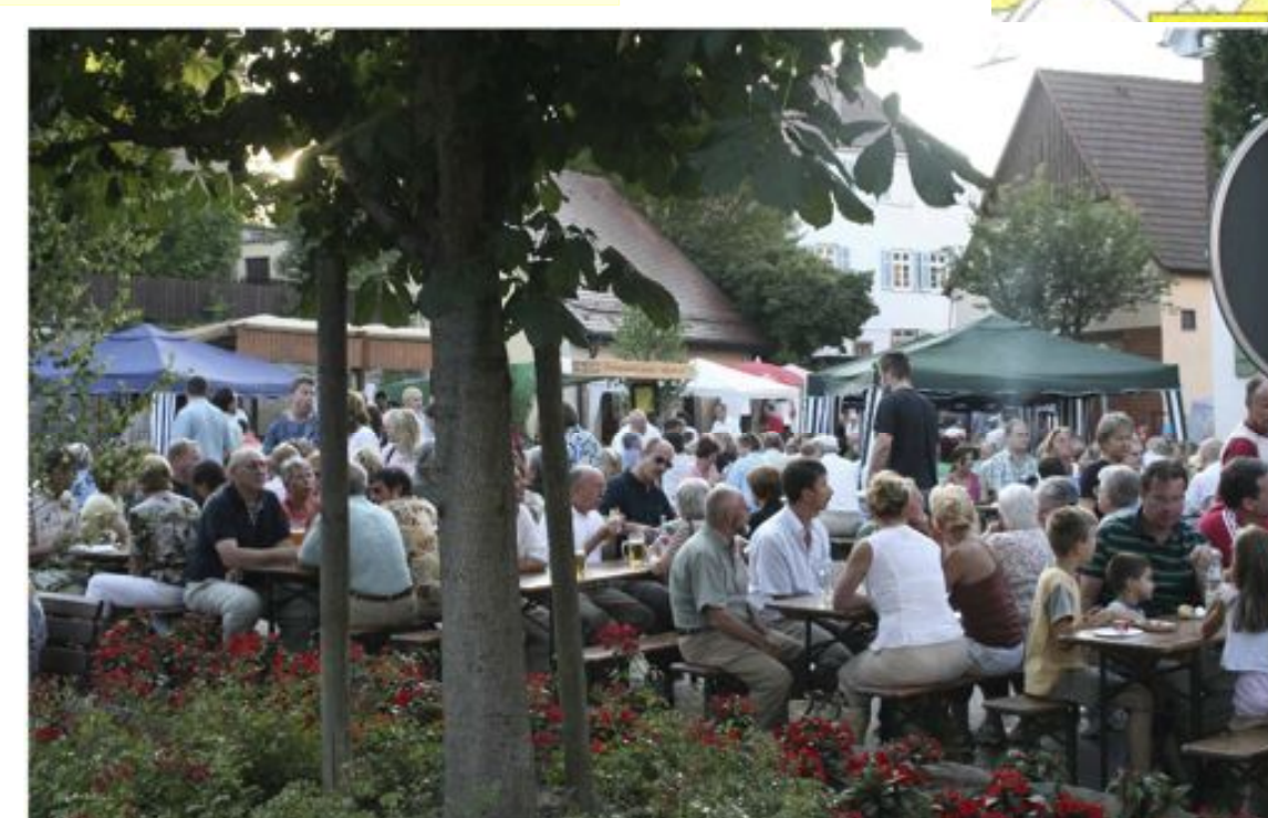
Die Ergebnisse werden gefeiert