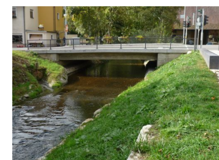
Brücke in Scharnhausen