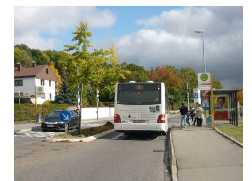
Bushaltestelle mit Bauminsel bremst den Verkehr und hilft den Fußgängern in Ruit (Landesstraße)