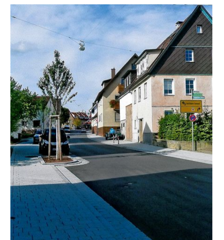
Verkehrsberuhigung durch Baumstandorte im Straßenraum