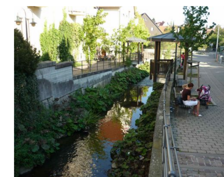
Bachhäusle in Neuhausen