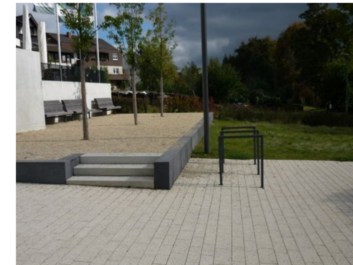
Sitzplatz an der Körsch