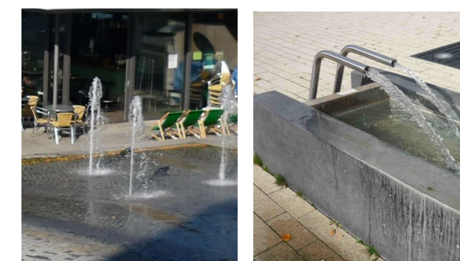
Spielbrunnen in Neuhausen und Scharnhausen