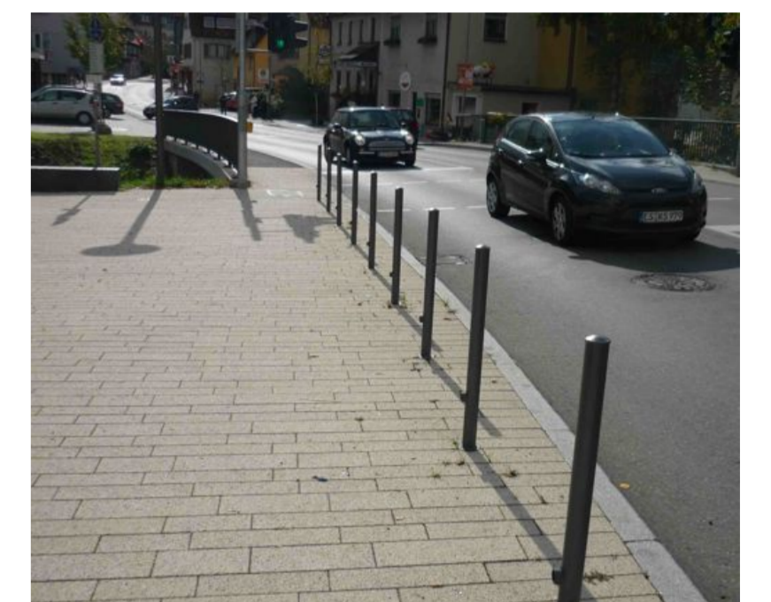
Platz und Brücke in Scharnhausen